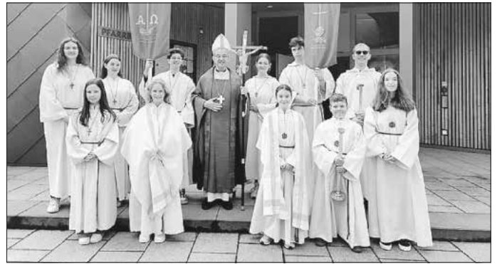
Herzlichen Dank an unsere Ministranten aus Essingen und Fachsenfeld.